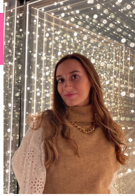
estudiante de publicidad